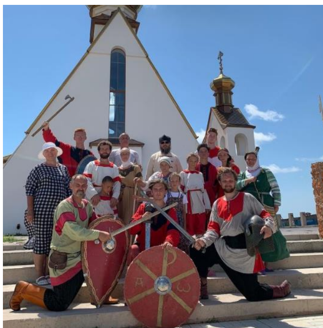
Сводная Богатырская Дружина из Марий Эл, Ставрополя, Черноморского и Переславля. Плечом

На сегодняшний день, помимо Переславской Богатырской заставы, действуют более 5 центров "Богатырская застава" в регионах: Шукшанская Богатырская Застава в Марий Эл, Знаменская Богатырская Застава в Орле, Черноморская Богатырская Застава в Крыму, Тульская Богатырская Застава, Красноярская Богатырская Застава, Ставропольская Богатырская застава в Тольятти.